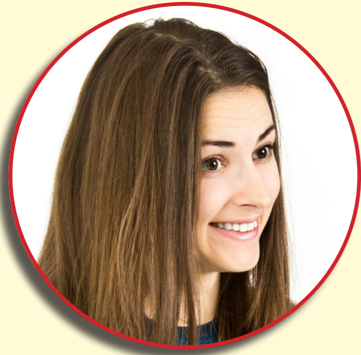
聞き手 ジャーナリスト